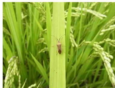
ホソハリカメムシ