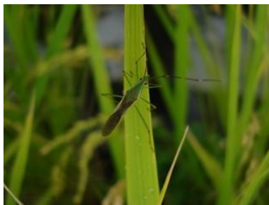
クモヘリカメムシ