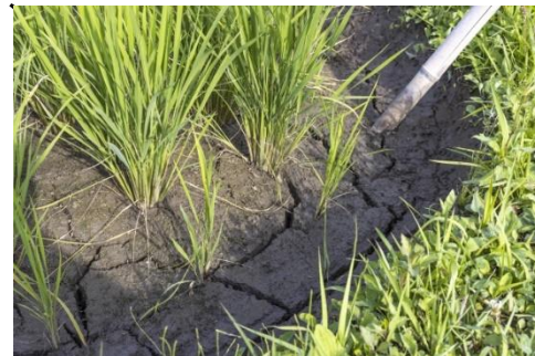
中干し終了後の田面の目安