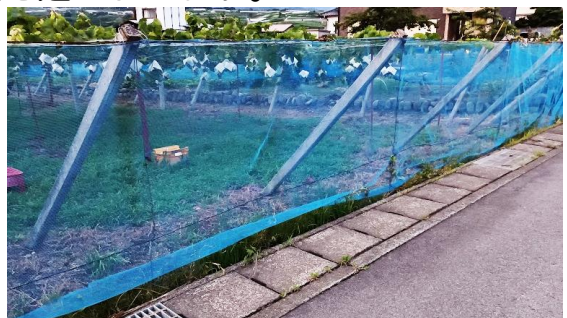
ブドウ盗難防止用ネット