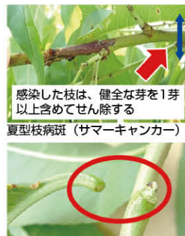
感染した枝は、健全な芽を1芽以上含めてせん除する 夏型枝病斑 (サマーキャンパー)