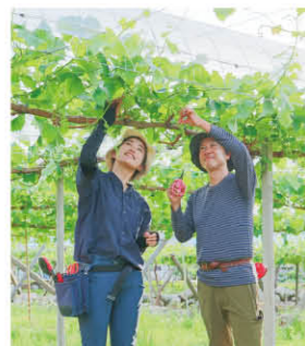
シャインマスカットのトンネルメッシュ。「5月中旬から摘芯することで玉張りもよくなる」と話します。

「すいかばか」は、「スイカ割りす るヤツに売るスイカはねえ!」と客 を追い返したのを、偶然見ていた常 連さんが付けたニックネームだそう です。