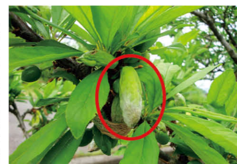
幼果が肥大してそら豆のさやのように奇形化する