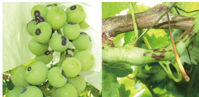
果粒や枝、葉に黒い斑点が現れる

棚に残った巻ひげや被害枝が伝染源となり、4月下旬頃から降雨により葉や新梢、果実へ感染します。