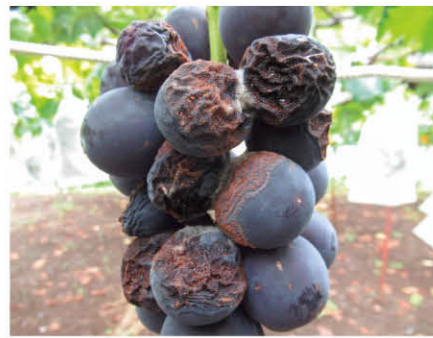
果粒が軟化腐敗する