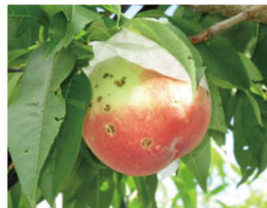
果実や枝に黒褐色の斑点が現れる。重症化すると落葉する