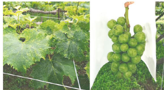
●えそ果病 葉にモザイク症状が現れ、新梢節間が短縮、果実表面から内部にかけて壊死する